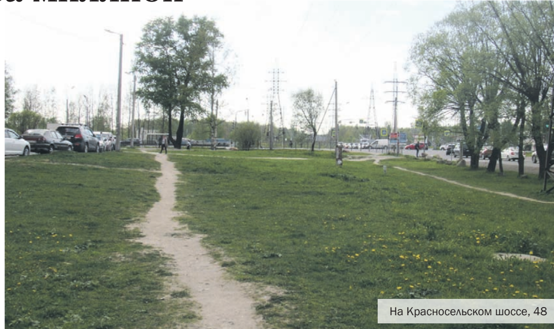
На Красносельском шоссе, 48

Второй ордер ГАТИ касается территории на Красносельском шоссе, 48, где планируется