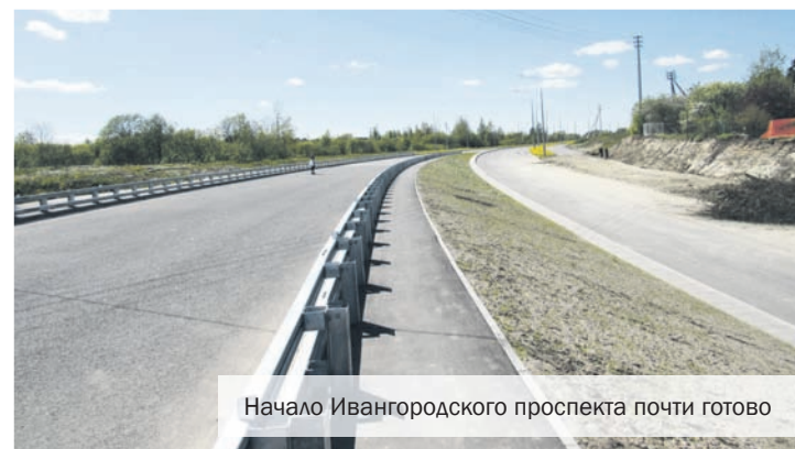
Начало Ивангородского проспекта почти готово

В Смольном утвержден проект планировки и межевания территории под строительство транспортного обхода Красного Села. Там надеются, что это решение позволит завершить процедуру изъятия земель и ускорить проект.